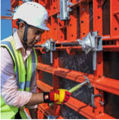
Kama klipsi ve hizalama kelepçesi; panelleri, şantiyelerdeki ihtiyaçlara göre verimli ve uygun maliyetli bir şekilde bağlamak için kullanılır.

Eğimli, kalın profiller ve üstün çelik kalitesi HANDSET Alpha'yı dayanıklı ve onarımı kolay hale getirerek bakım maliyetlerini azaltır. Az sayıda bileşen ve yeniden kullanılabilir toz boyalı paneller, sahadaki malzeme kayıplarının yanı sıra kereste israfını da en aza indirir. HANDSET Alpha bu özellikleri sayesinde; ürün arama süreleri, eksik sistem parçaları, iade sorunları ve atık - malzeme yönetimi maliyetleri gibi şantiyelerde sık karşılaşılan sorunlara çözüm getirir.