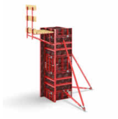
Esnek kolon boyutları 150 x 150 mm ile 900 x 900 mm, arasında değişen kolon boyutları, ekstra tie - rod çubuğuna ihtiyaç duyulmaksızın oluşturulabilir.