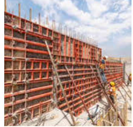
Çok amaçlı paneller, her 5 cm'de bir entegre delikleriyle çoklu perde ve kolon uygulamalarında daha fazla esneklik sağlar.